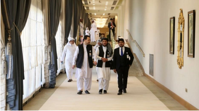
د تړون مراسمو ته د ننوتلو په حال کې - شريټون هوټل