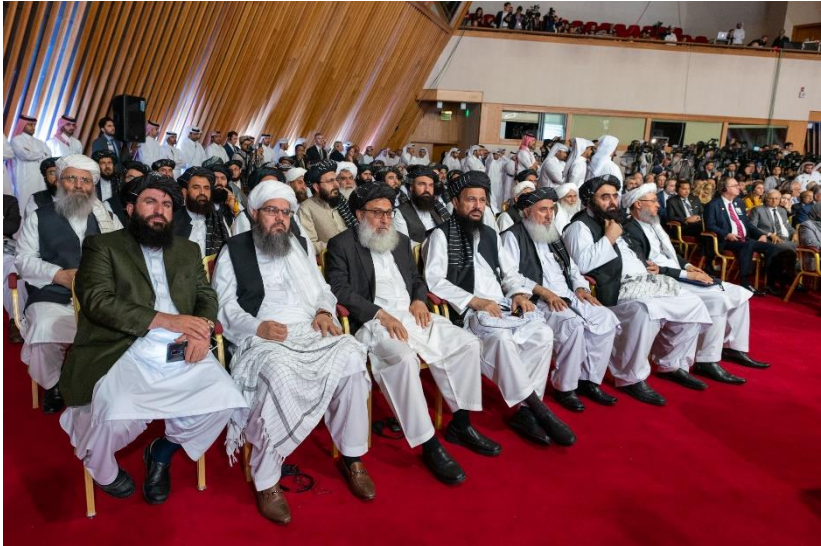
انځور: د تړون مراسمو کې طالب مشران

د مارچ ۴مه، سهیل شاهین ولیکل: "اسلامي امارت له پلان سره سم د توافقنامې ټولې برخې یو په بل پسې عملي کوي تر څو د جنگ د شدت مخه ونیول شي. مقابل لوری دې هم د توافقنامې د ټولو برخو په عملي کولو کې خنډونه له منځه یوسي ترڅو سرتاسري سولې ته لاره هواره او افغان اولس له خپلو اساسي حقوقو برخمن شي".