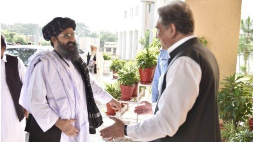
د پاکستان د بهرنیو چارو وزیر شاه محمود قریشي او ملا برادر اخوند

د سیگار د موندنو پر اساس د سولې عالي شورا هڅې یې اغېزه او له فساده ډکې دي او له همدې امله نړیوالو مرستندویه هېوادنو او مؤسسو ورسره خپلې مرستې هم درولي دي."