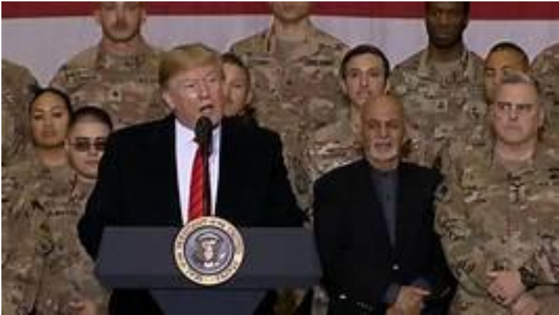
انځور: ولسمشر ترمپ او ډاکټر غني په باگرام پوځي اډه کې

د امريكا ولسمشر-ډونالډ ترمپ په سوريې كې د روسيې د مداخلې په اړه د اكتوبر پر ۱۶مه، په سپينې ماڼۍ كې د ايتاليا له ولسمشر- سره په خبرې كنفرانس كې وويل: "ماسكو په سوريه كې مداخله كولى شي خو بايد په افغانستان كې هم خپله مداخله هېره نكړي. دا د سوريې خوښه ده چې له روسيې او بل هر چا سره ملگرتيا او ايتلاف ولري، او زه ورته ښه چانس غواړم. تاسو پوهيږئ روسيه، چې شوروي اتحاد بلل كېده. په افغانستان كې هم ښكېله وه. اوس يې روسيه بولي، ځكه چې دوى په افغانستان كې ډېر لگښت وكړ او له همدې كبله دغه اتحاد كوچنى شو، بيخي كوچنى".