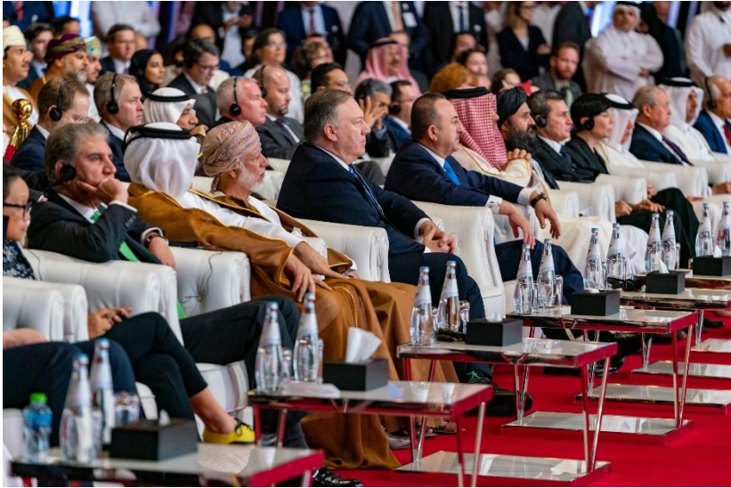
د امریکا-طالبانو د سولې تړون د مراسمو انځور

زه د هغه کار ستاینه کوم چې قطر ډیرو خلکو ته د سولې په راوستلو کې کړي دی، او زه د نورو خلیجی هیوادونو څخه غواړم چې د دې کار اهمیت وپېژني، او ناحقه نامني راوباسي. الله دې درباندي برکت وکړي."