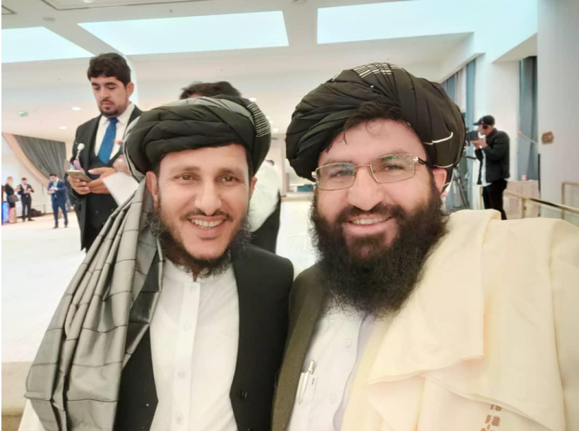
مولوي احمدالله وثيق او زه (مطمئن). شريټون هوټل