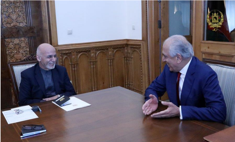
ډاکټر اشرف غني او ډاکټر زلمی خلیلزاد

يو شمېر کړۍ هڅه کوي، د افغان حکومت په سر معامله وکړي او په راتلونکي کې داسې يو حکومت رامنځته کړي چې مشروعيت يې د څو کسانو څخه تر لاسه کړي.