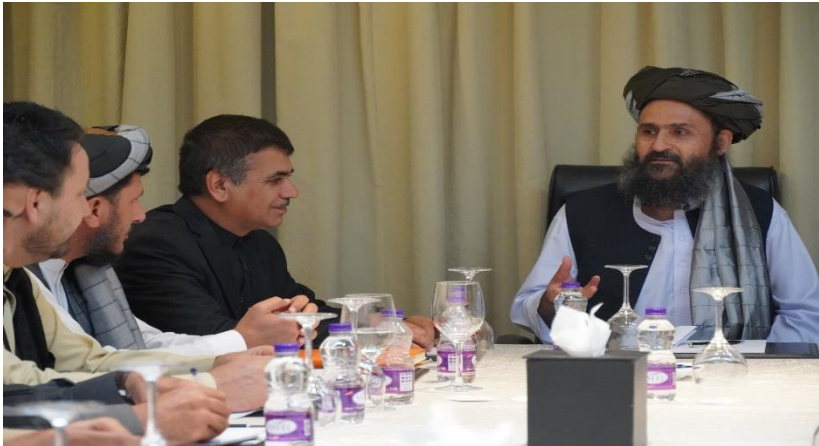
انځور: قطر کې له ملا برادر اخوند سره زموږ ناسته، نومبر ۲۰۱۹

د کانگرس په لیک کې راغلي: "تر کومې چې زه "ایلیویټ" خبر یم دغه هوکړه لیک د ولسمشر- ټرمپ له ادارې او ولسمشر- غني سره شریک شوی دی. اوس د امریکا او افغانستان ولس هم حق لري چې د خپلو هیوادونو په تگلارو پوه شي. سره له دې چې تاسي (خلیلزاد) ډیر ناوخته دغه غونډې ته رابولو خو بیا هم ناوخته نه ده. ستاسي حضور او په دغه اړه وضاحت به د امریکا خلکو ته دا فرصت ورکړي چې د طالبانو په اړه د امریکا د پالیسی او طالبانو سره د سولې کولو سیاسي تهدیدونو په اړه پوه شي."