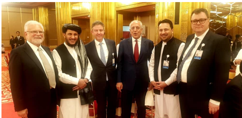
پټر، ځلاند، خليلزاد، سفير، مطمئن او بارنيت روين. دوحه - فبروري ۲۹ مه ۲۰۲۰

په دغو ډيپلوماتانو کې پنځه تنه په کابل کې د امريکا سفيران پاتې شوي، يو يې د افغانستان لپاره د امريکا د ځانگړي استازي په توگه دنده ترسره کړې او يو يې د امريکا د بهرنيو چارو وزارت پخوانی مرستيال دی.